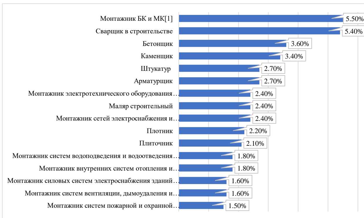
Рис. 2. Актуальные профессии (Строительство)

При анализе распределения ответов респондентов мы можем выделить наиболее востребованные профессии среди двух групп профессий: «строительство» и «машинисты дорожных и строительных машин». Визуально распределение ответов по данным группам представлено на рисунках 1 и 2 соответственно.