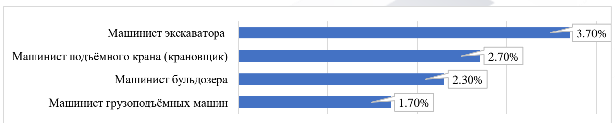
Рис. 5. Востребованные в будущем профессии (Машинисты)

Респонденты в своих прогнозах относительно востребованности профессий в будущем приводят аналогичные вопросу S4 мнения – наиболее востребованные профессии в группе «строительство»: «Монтажник ЖБК и металлоконструкции» (4,9% ответов), «Сварщик в строительстве» (4,5% ответов), Бетонщик (3,5% ответов), Каменщик (3,2% ответов), Арматурщик (2,8% ответов), Штукатур (2,5% ответов).