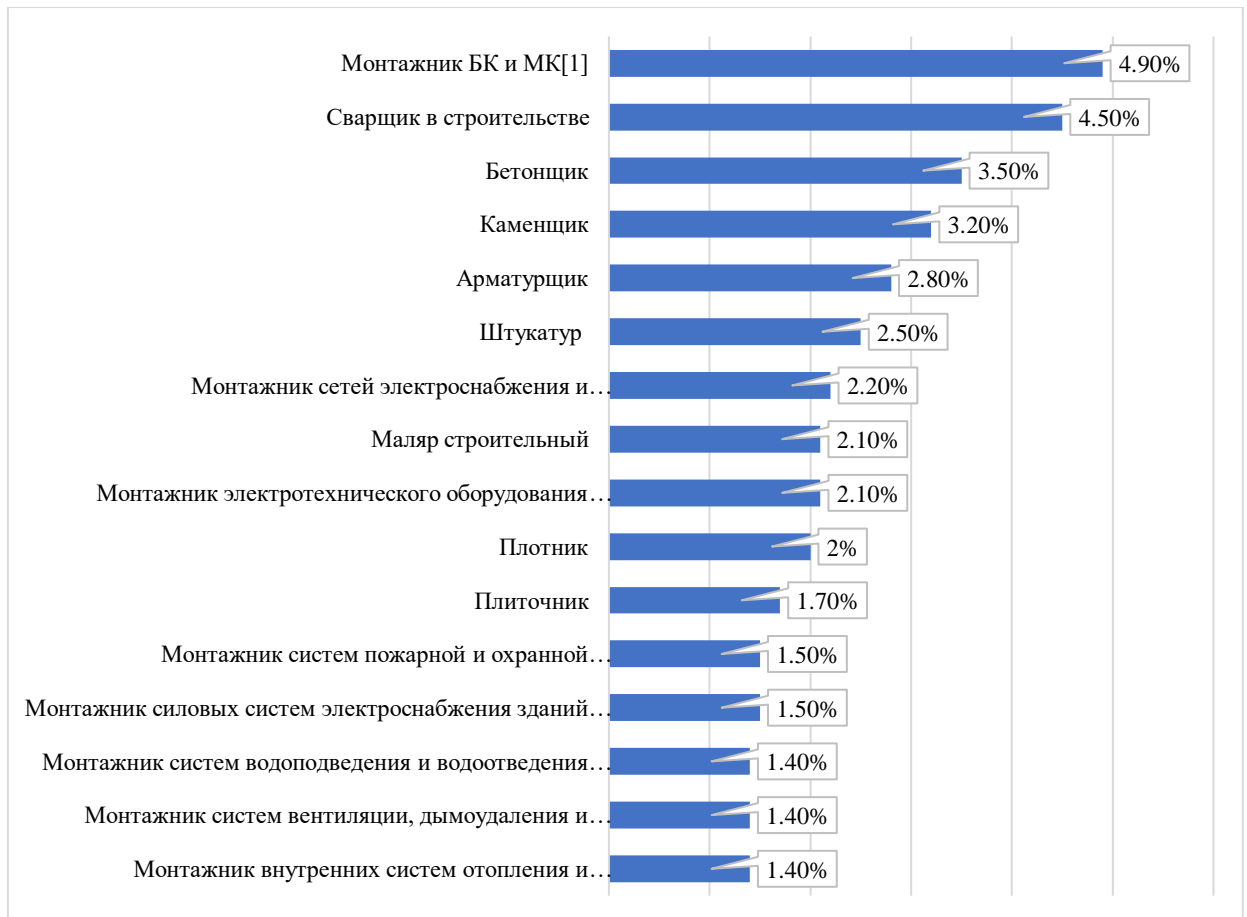
Рис. 4. Востребованные в будущем профессии (Строительство)

Аналогично вопросу S4 распределения ответов типированы на две группы: «строительство» и «машинисты дорожных и строительных машин» и визуально представлены на рисунках 4 и 5.